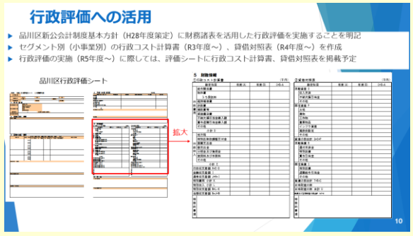
▲行政評価への活用（品川区の配信資料より）

さらに、令和5年度からは、本区の特別会計も含めた小事業の665事業を対象に事務事業評価を実施しています。事務事業評価では、事業の実績や課題などを明らかにし、必要性、有効性、効率性を分析・検証の上、評価を行います。また、事務事業評価を実施するとともに、区民意見を踏まえた政策評価を実施するなど、新たな行政評価制度としてスタートしました。