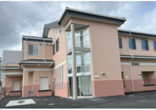
精華町防災食育センター